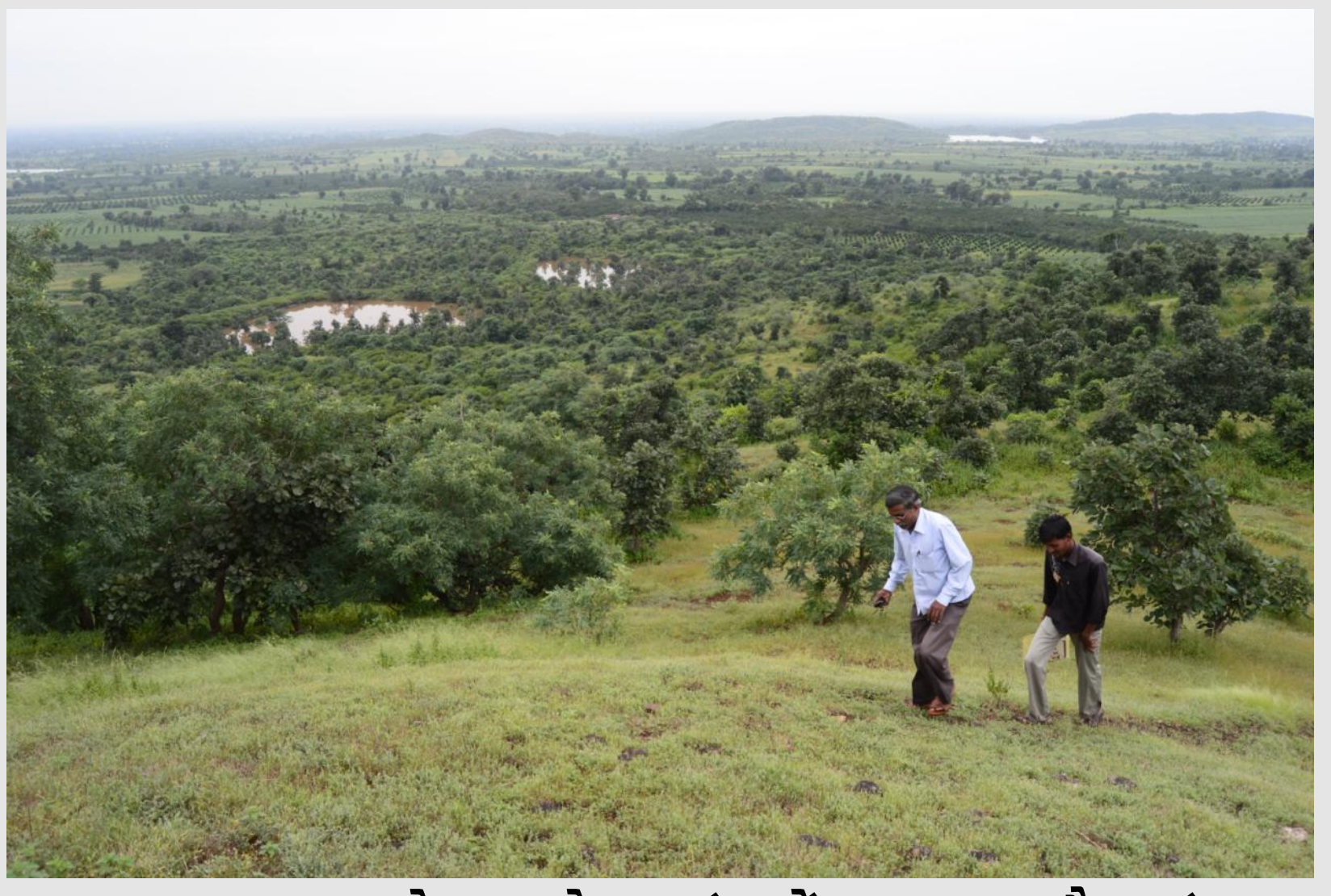
ऊपर: महाराष्ट्र के नयाखेड़ा गांव में चरागाह और जंगल का सहअस्तित्व जिसे वन अधिकार अधिनियम के माध्यम से स्थानीय समुदाय कानूनन सुरक्षा प्रदान कर रहा है।

महाराष्ट्र के नयाखेड़ा गांव में खोज ने इस कानून के अंतर्गत सामुदायिक वन अधिकार के लिए लोगों के आवेदन जमा कराए और आखिरकार २०१२ में गांव को इस मद में मंजूरी मिली। तब से समुदाय के लोगों ने ६०० हैक्टेयर से ज्यादा जंगलों की सुरक्षा के लिए कई अहम कदम उठाए हैं जिनमें यहां शिकार पर पाबंदी और जलावन के लिए पूरे के पूरे पेड़ों को काटने पर पाबंदी भी शामिल है। अगर कोई व्यक्ति चराई के लिए निषिद्ध इलाके में मवेशियों को चराता पाया जाता है तो उस पर जुर्माना भी लगाया जाता है। जंगल की आग को रोकने के लिए भी कदम उठाए गए हैं।