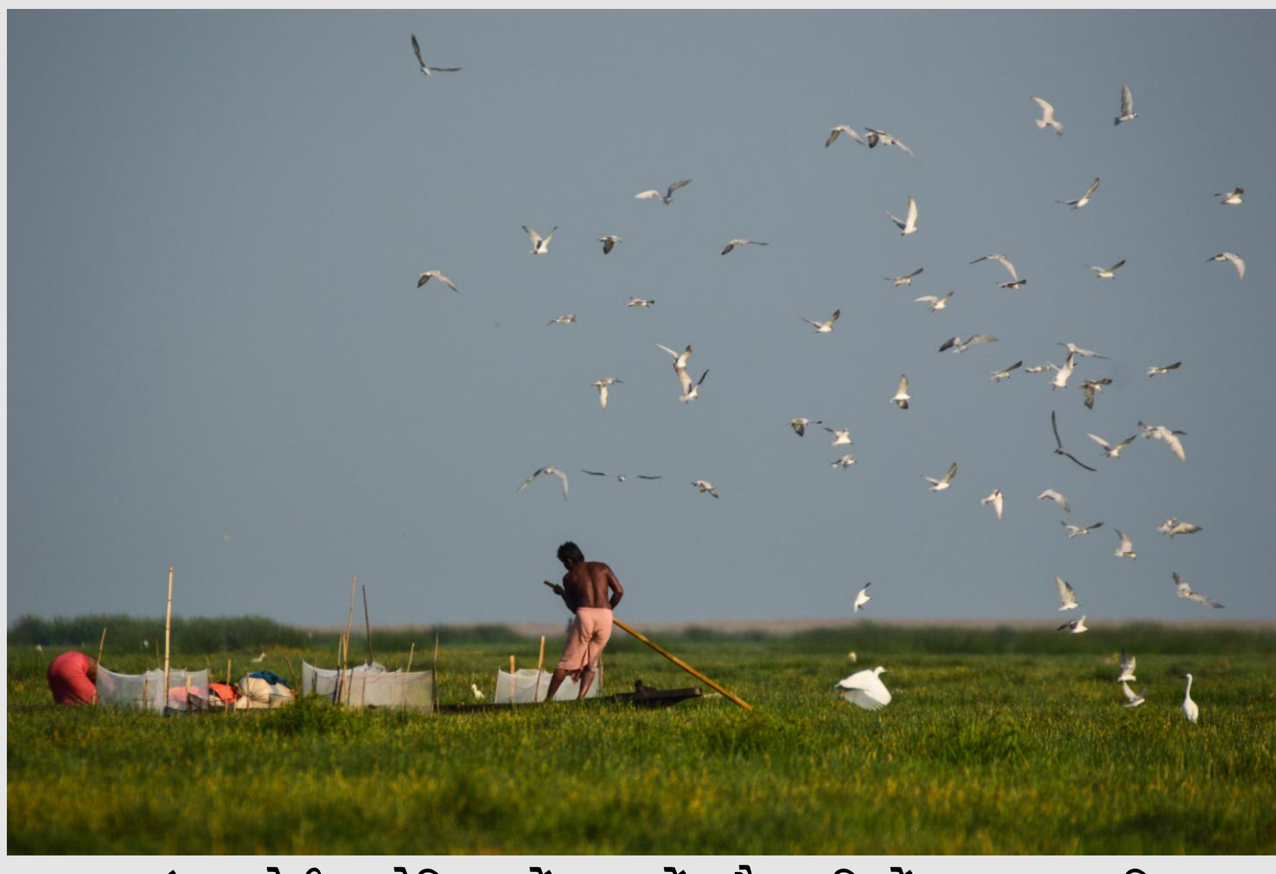
ऊपर: मंगलाजोड़ी, ओडिशा में मनुष्यों और पक्षियों का सह-अस्तित्व।

जंगलों को बचाने की यह सोच इंसानी इस्तेमाल के लिए मिलने वाले संसाधनों की आवश्यकता तक ही सीमित नहीं है बल्कि स्वयं जंगलों को बचाए रखने के महत्व पर भी आधारित है।