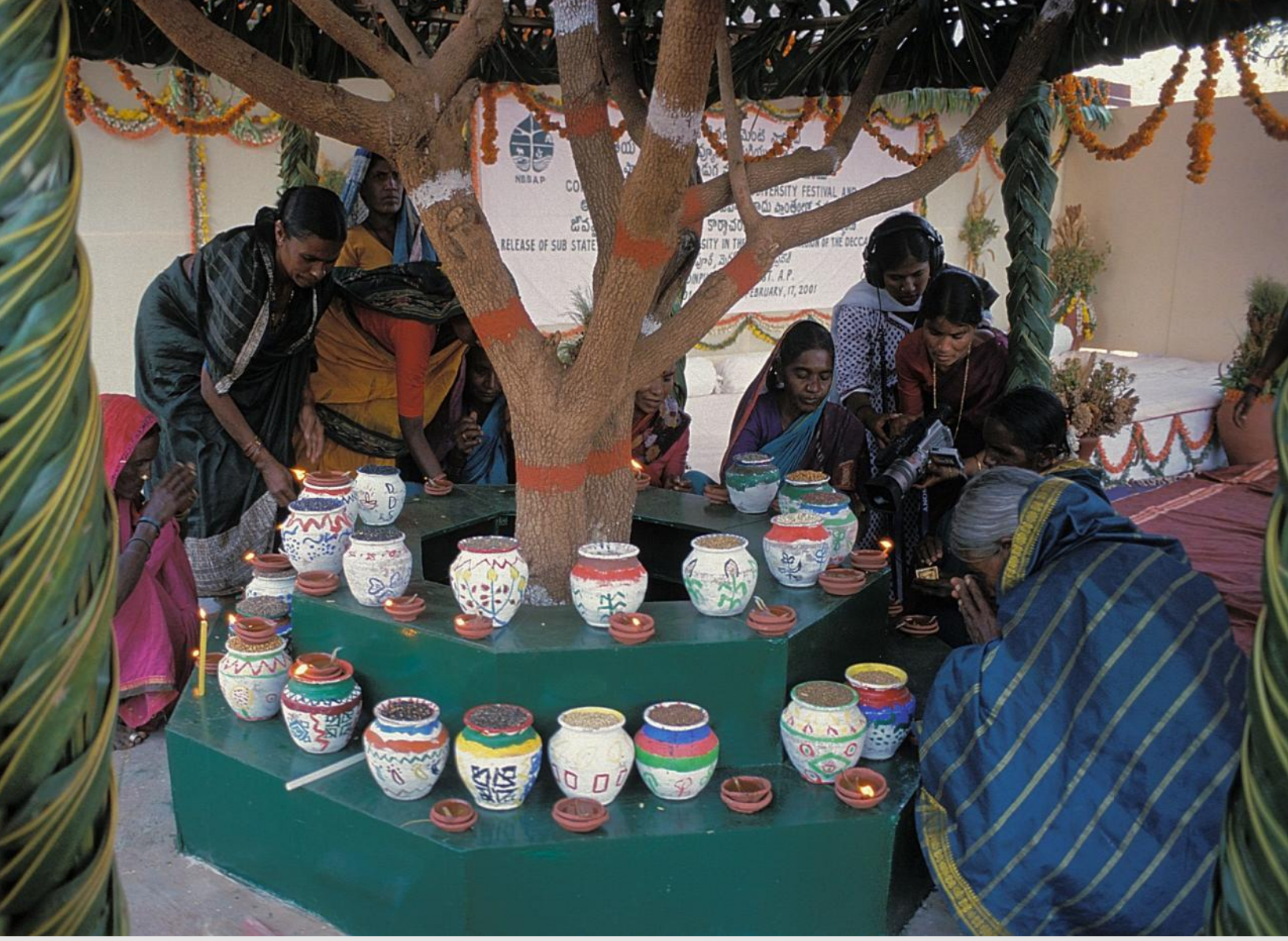
ऊपर: २००९ में डीडीएस द्वारा आयोजित किया गया एक घुमंतू जैव विविधता उत्सव।